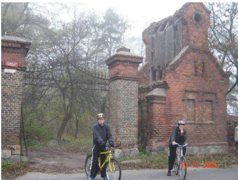
Rys. Brama wjazdowa do parku.

Na uwagę zasługuje również brama wjazdowa do parku od strony pd. z 2 poł. XIX. Słupki murowane o przekroju kwadratowym, nietynkowane, zwieńczone namiotowo. Wierzeje i nastawa kute żelazne a przy niej pozostałości stróżówki z 2 poł. XIX w. znajdujące się od południowej strony pałacu murowane nietynkowane, wąskie. Od frontu zamurowane podwójne okienko. Wyżej wysmukła nastawka, z bocznymi ścianami podbitymi deskami, o nie znanym przeznaczeniu.