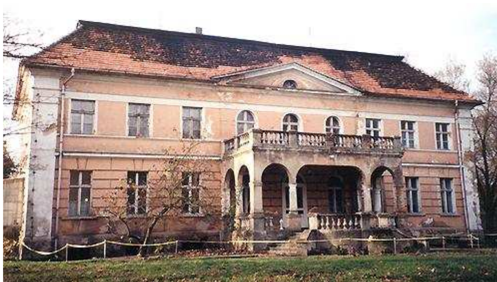
Rys. Pałac w Granówku.