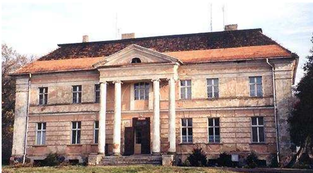
Rys. Pałac w Granówku.

Jesion wyniosły w parku na wsch. od pałacu ( obwód 370 cm, wysokość ok. 20 m )