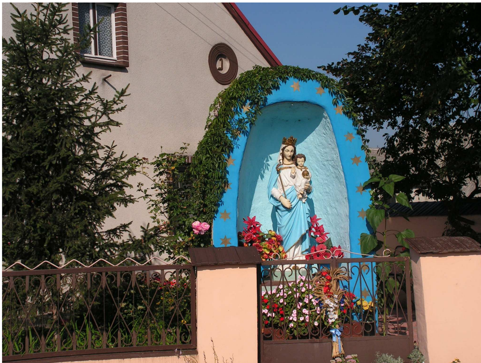
Rys. 5 Zabytkowa kapliczka.