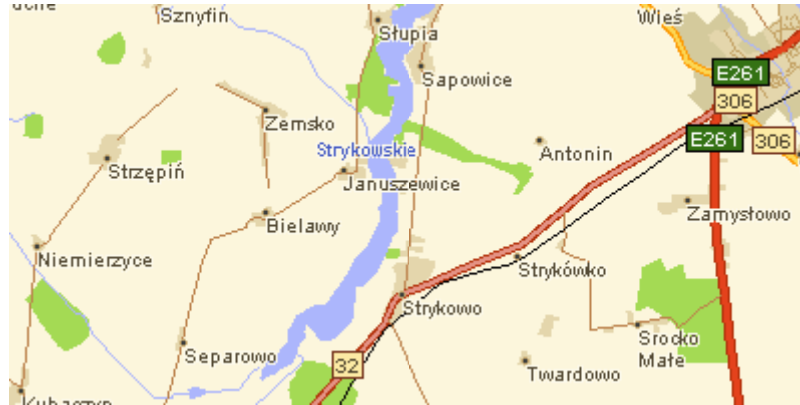
Rys. 1 Położenie wsi Januszewice.

Teren wsi nie posiada aktualnego miejscowego planu zagospodarowania przestrzennego.