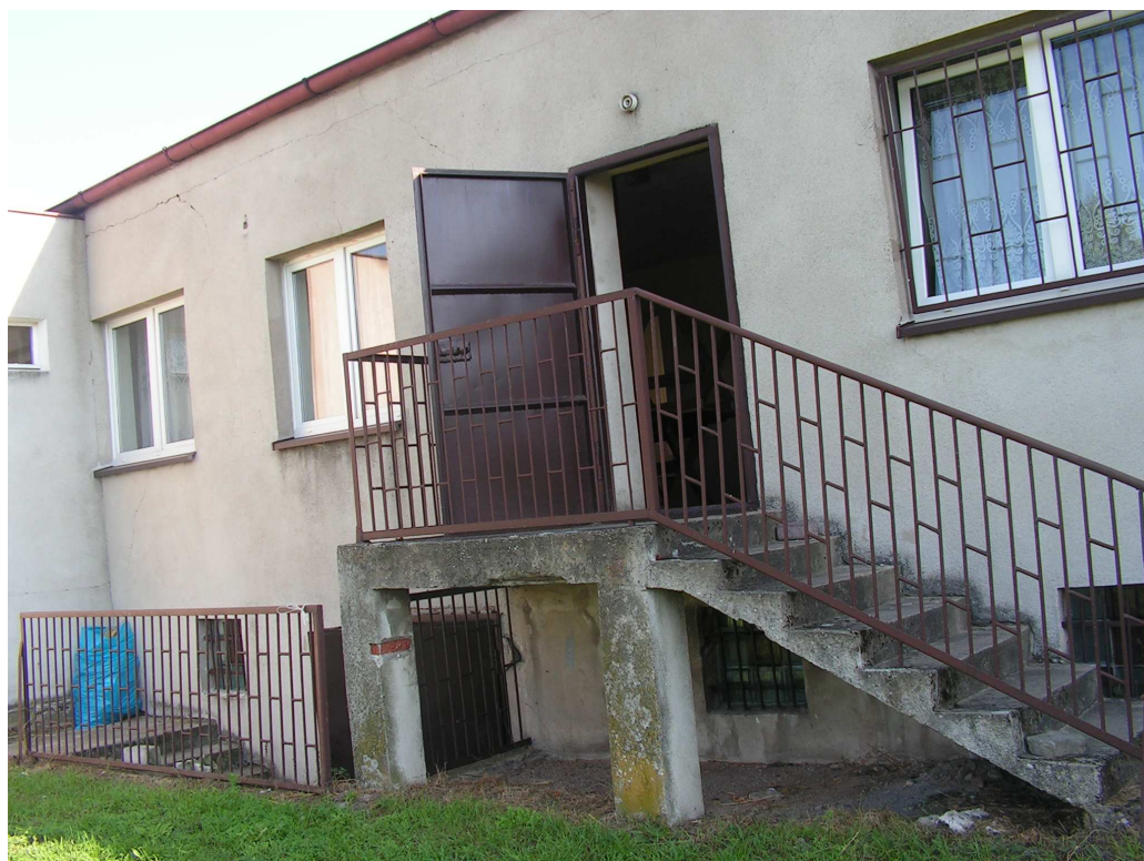
Rys. 8 Świetlica wiejska.