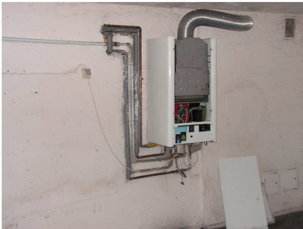
Rys. 12 Świetlica wiejska.