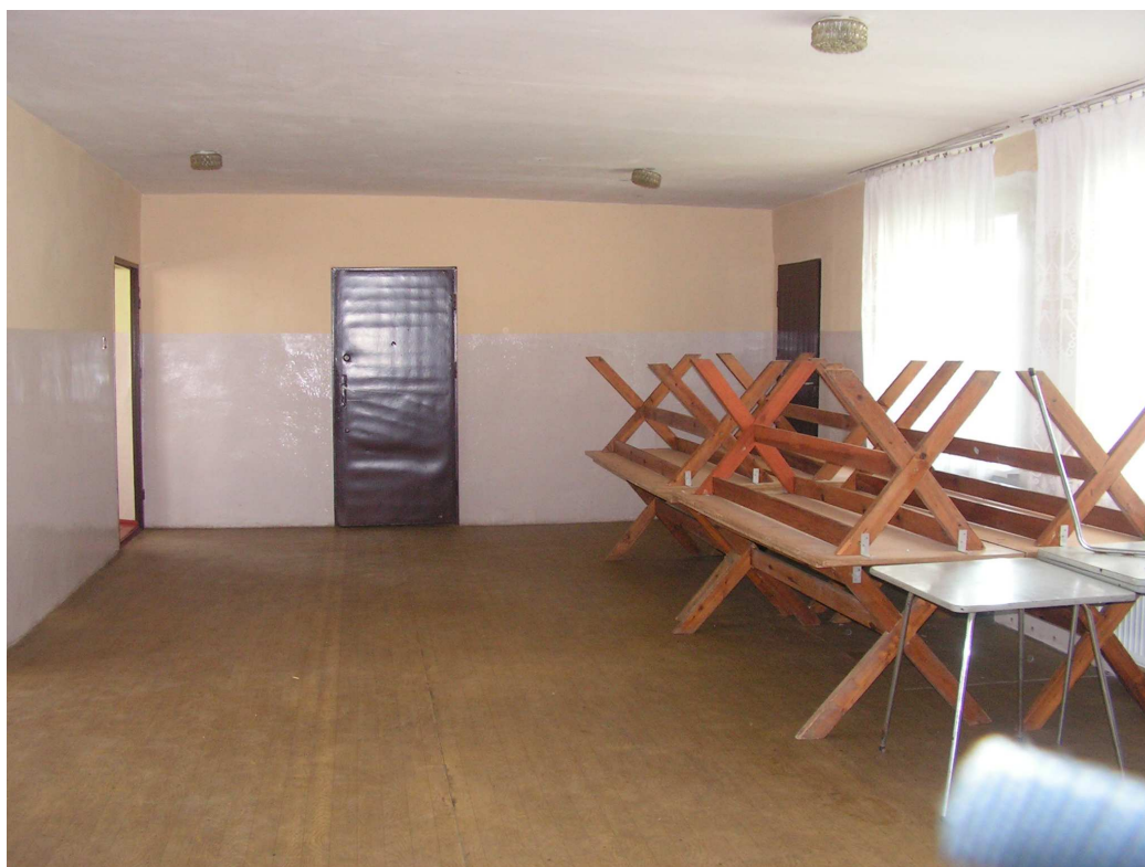
Rys. 13 Świetlica wiejska.