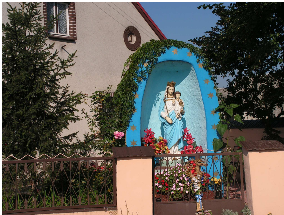
Rys. 5 Zabytkowa kapliczka.