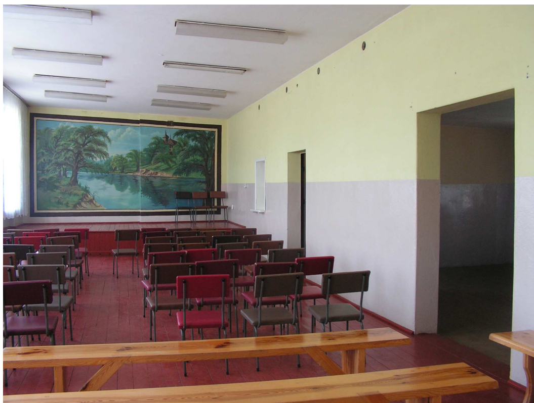
Rys. 10 Świetlica wiejska.