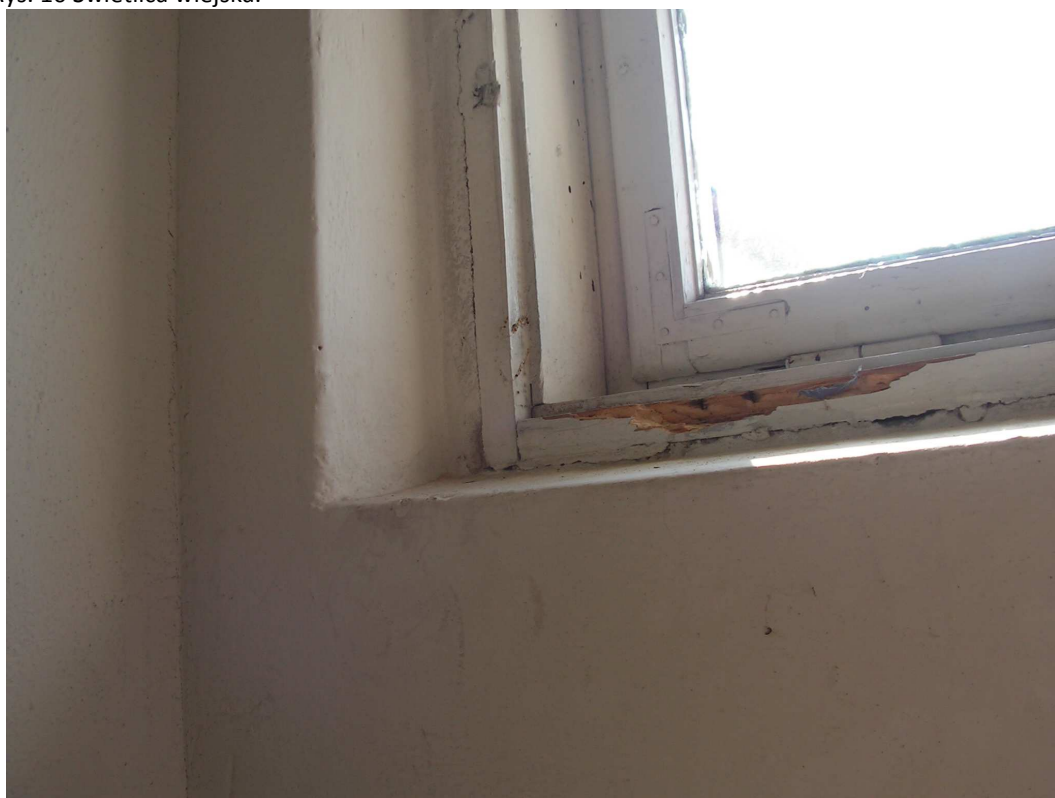
Rys. 11 Świetlica wiejska.