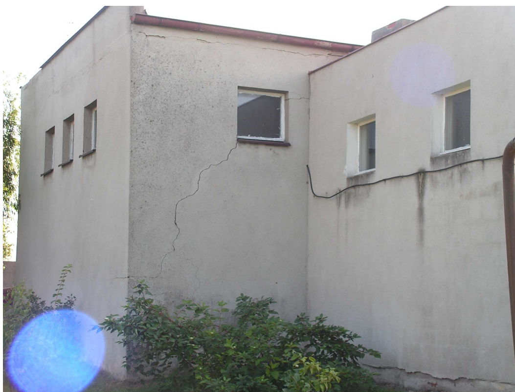
Rys. 9 Świetlica wiejska.