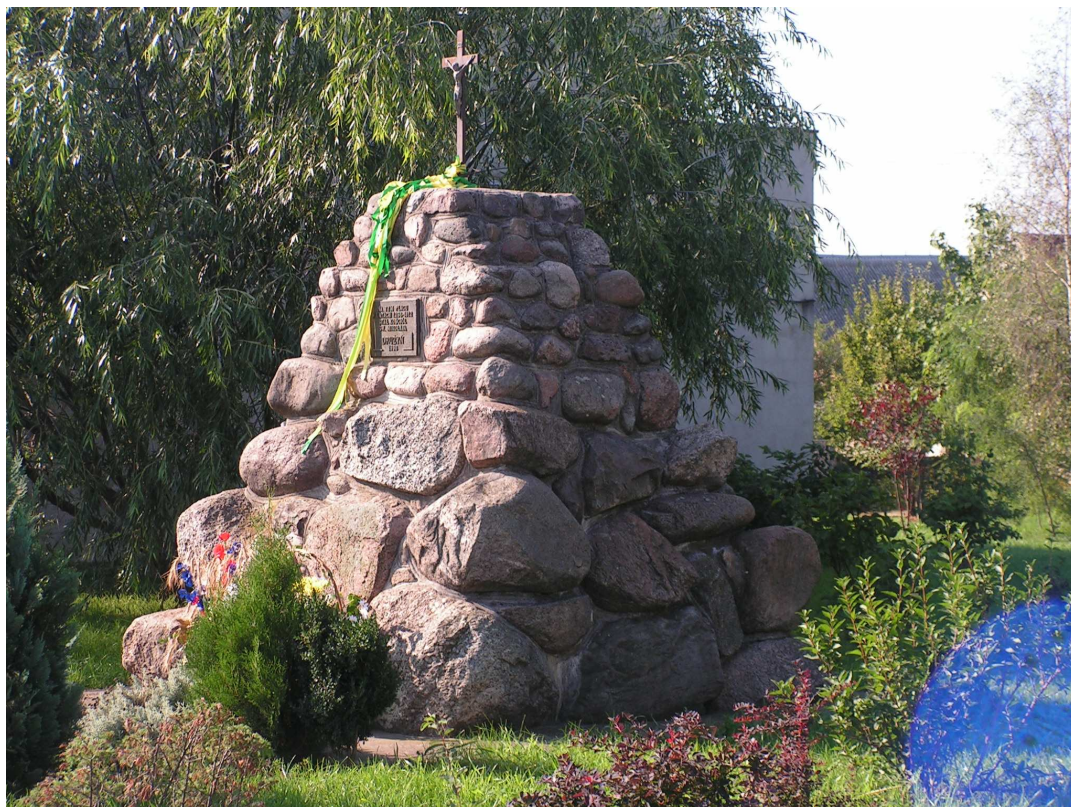
Rys. 4 Tablica upamiętniająca kościół parafialny św. Mikołaja.

W końcu XIX wieku okolica wyróżniała się czysto polskim charakterem i małą liczbą analfabetów, mimo znacznej przewagi robotników rolnych. Obecnie jest to wieś o zwartej zabudowie przy kilkunastu ulicach, z wieloma nowymi domami. Od końca lat pięćdziesiątych datuje się intensywny rozwój budownictwa mieszkaniowego.