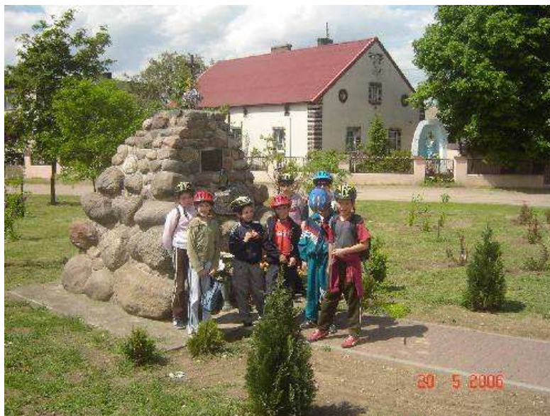
Rys. 7 Pomnik z kapliczką w oddali.

Na tym miejscu (kamienny pomnik) stał kościół z pocz. XIII w. W oddali jest widoczna kapliczka – grotta.