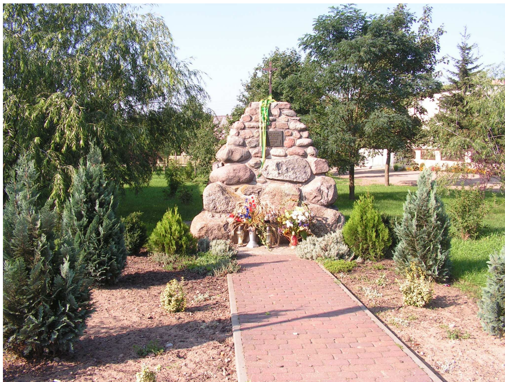
Rys. 2 Tablica upamiętniająca kościół parafialny św. Mikołaja.