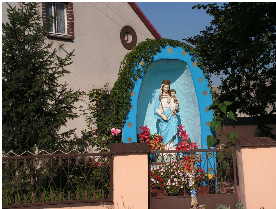
Rys. 5 Zabytkowa kapliczka.