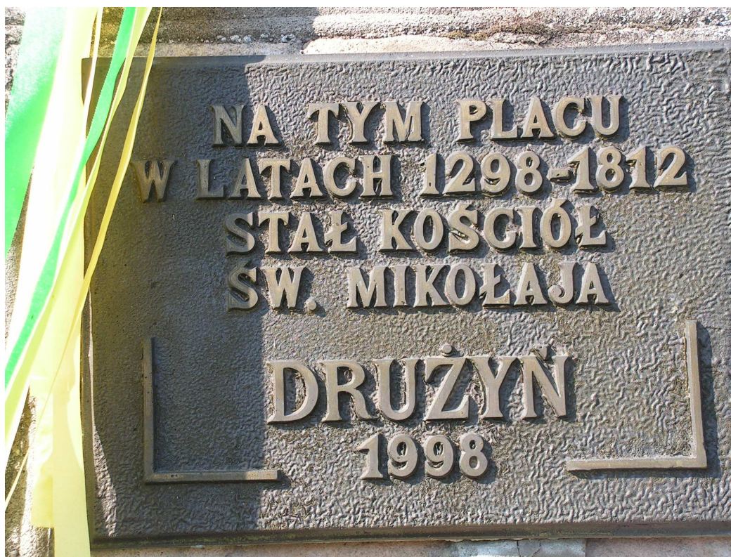
Rys. 3 Tablica upamiętniająca kościół parafialny św. Mikołaja.