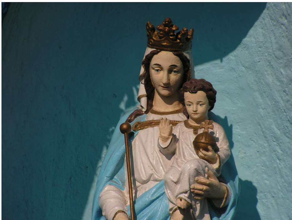
Rys. 6 Zabytkowa kapliczka.

Na tym miejscu (kamienny pomnik) stał kościół z pocz. XIII w. W oddali jest widoczna kapliczka – grotta.