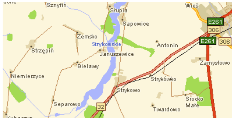
Rys. 1 Położenie wsi Januszewice.

Teren wsi nie posiada aktualnego miejscowego planu zagospodarowania przestrzennego.