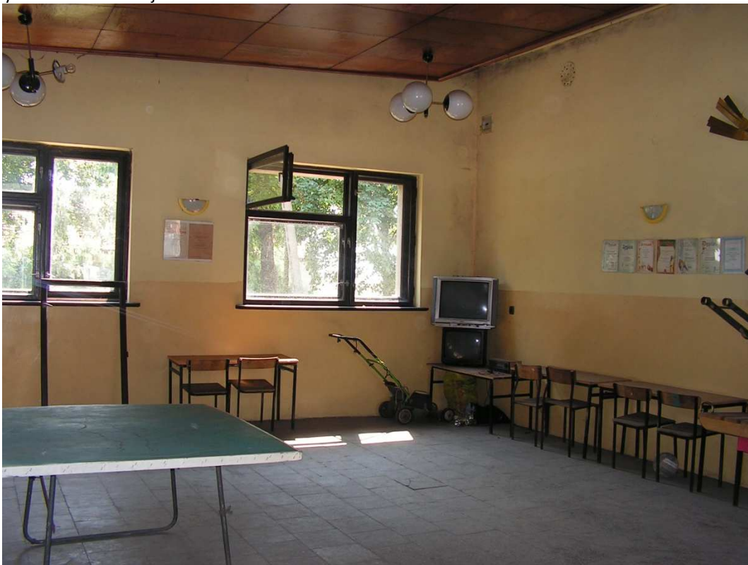
Rys. 13 Świetlica wiejska w Granówku.