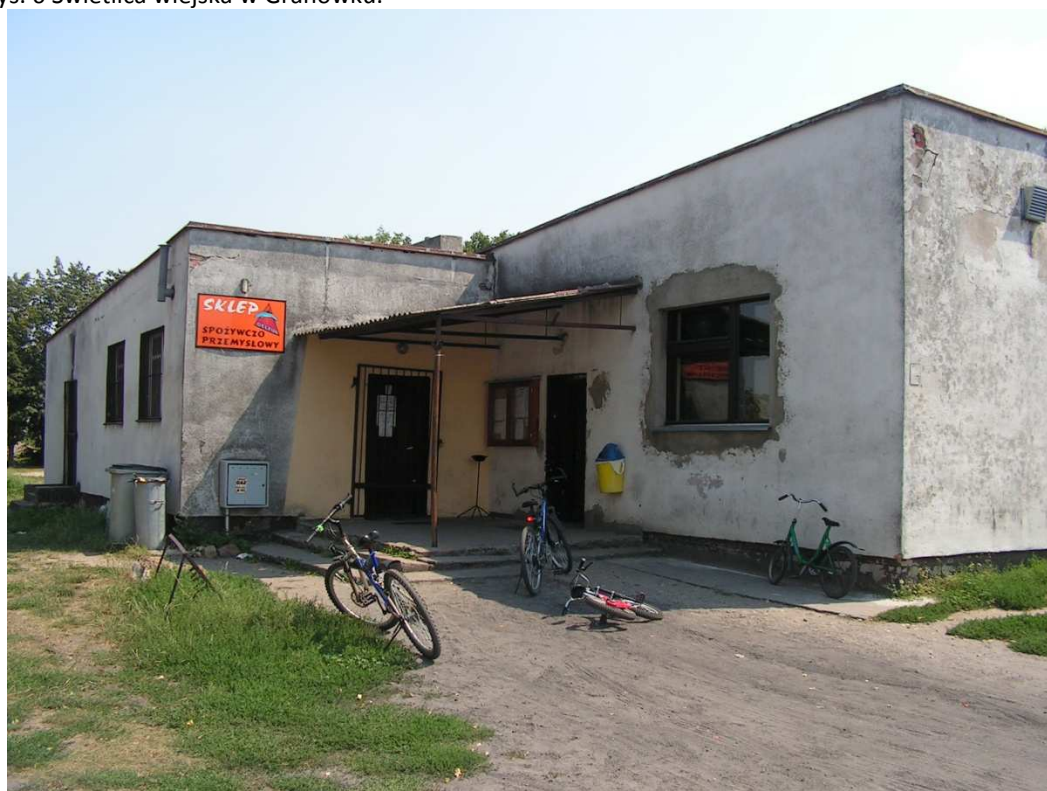
Rys. 7 Świetlica wiejska w Granówku.