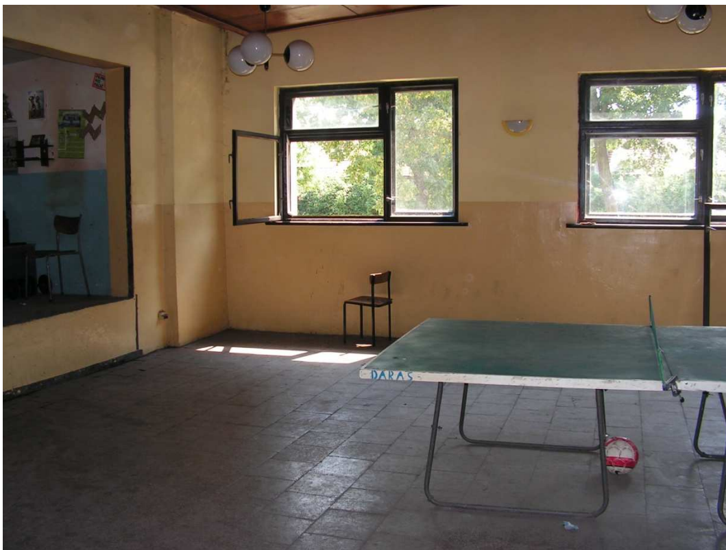
Rys. 12 Świetlica wiejska w Granówku.