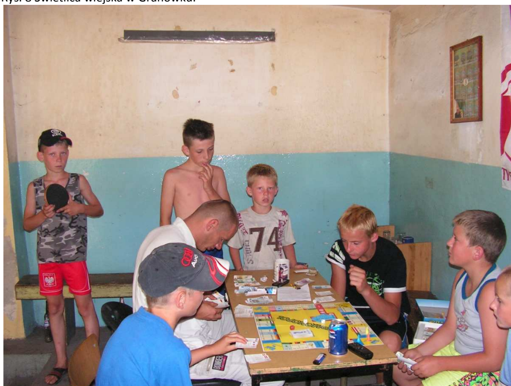
Rys. 9 Świetlica wiejska w Granówku.