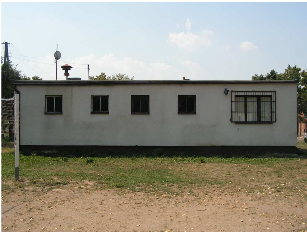
Rys. 6 Świetlica wiejska w Granówku.