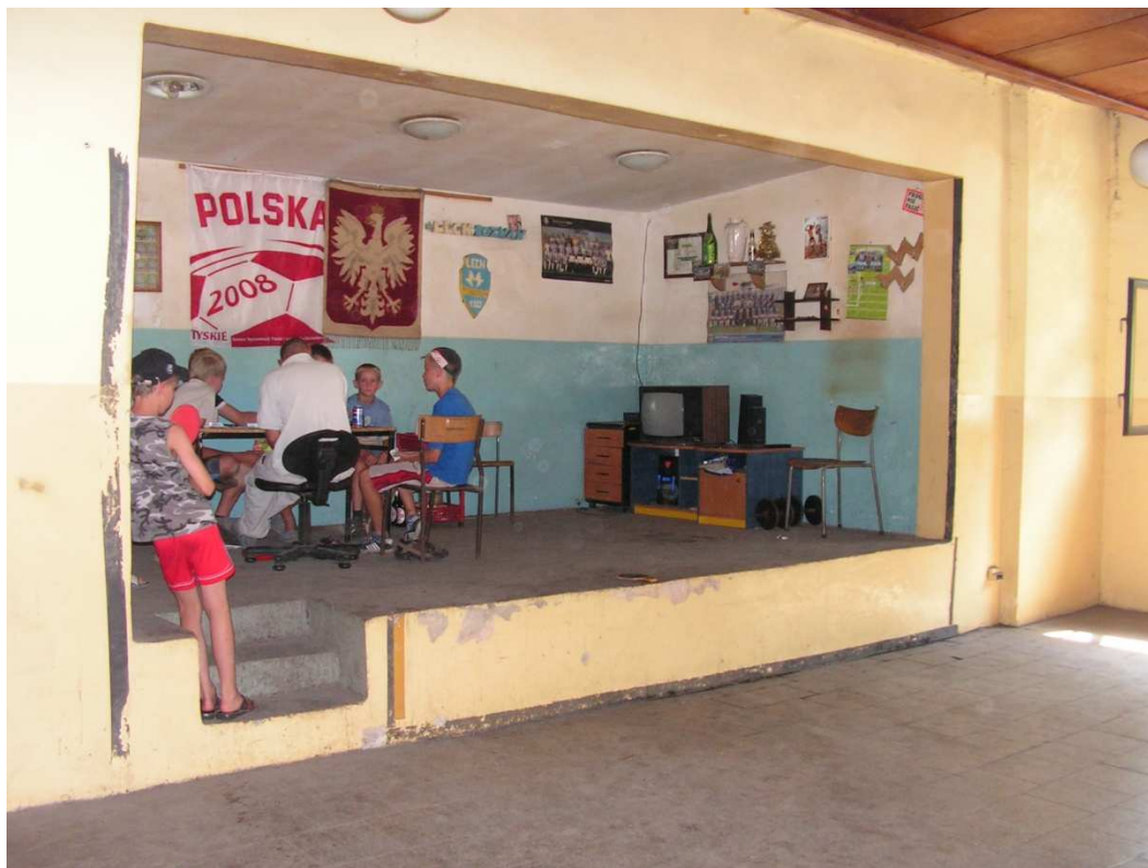
Rys. 8 Świetlica wiejska w Granówku.