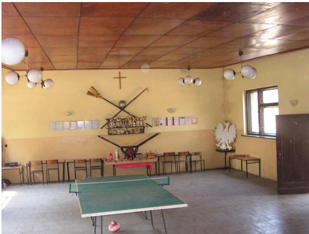
Rys. 10 Świetlica wiejska w Granówku.