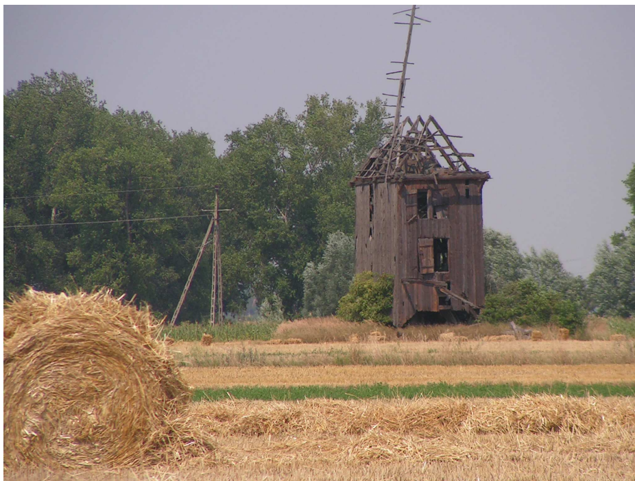
Rys. 5 Wiatrak „Kozłak”