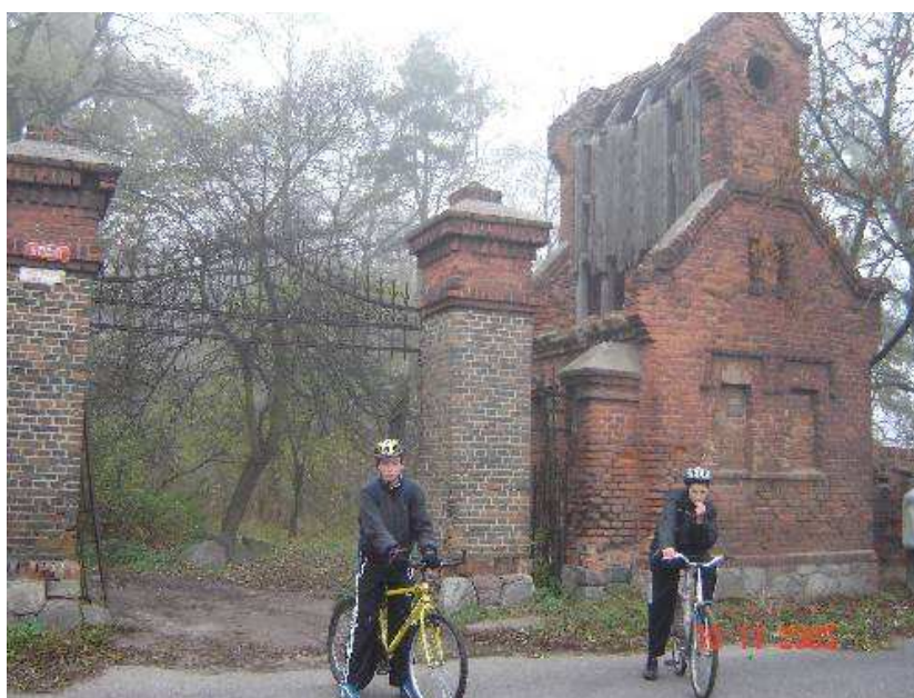
Rys. 4 Brama wjazdowa do parku.

Na uwagę zasługuje również brama wjazdowa do parku od strony pd. z 2 poł. XIX. Słupki murowane o przekroju kwadratowym, nietynkowane, zwieńczone namiotowo. Wierzeje i nastawa kute żelazne a przy niej pozostałości stróżówki z 2 poł. XIX w. znajdujące się od południowej strony pałacu murowane nietynkowane, wąskie. Od frontu zamurowane podwójne okienko. Wyżej wysmukła nastawka, z bocznymi ścianami podbitymi deskami, o nie znanym przeznaczeniu.